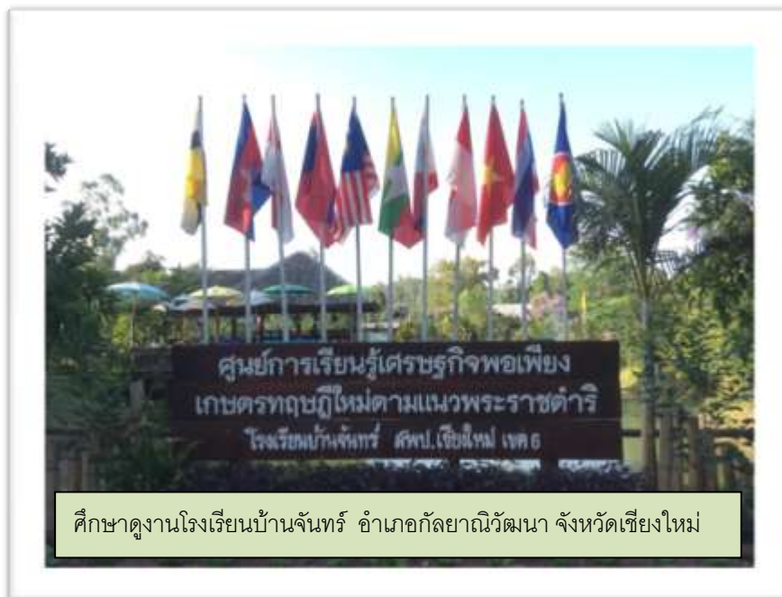
ศึกษาดูงานโรงเรียนบ้านจันท์ อําเภอกัลยาณิวัฒนา จังหวัดเชียงใหม่