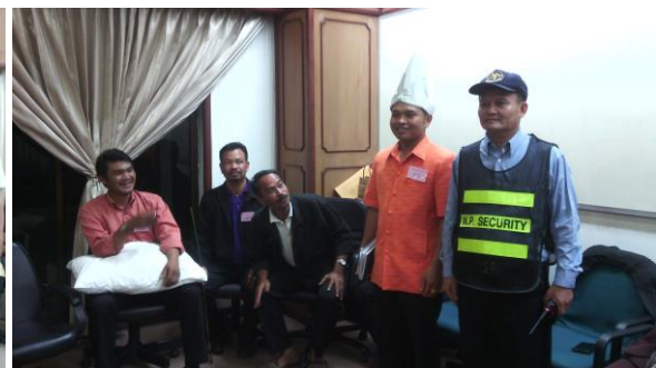
กิจกรรม “ครูสอนคิด” ลักษณะกิจกรรมคือการแสดงบทบาทสมมุติ และแสดงตัวตนให้ผู้เข้ารับการอบรมกลุ่มอื่นๆ สามารถบอกตัวตนที่แสดงออกได้