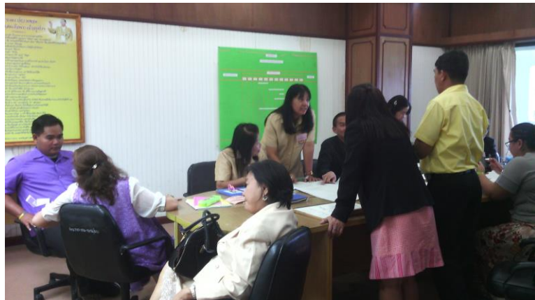
ฝึกปฏิบัติการออกแบบกิจกรรมการบูรณาการคุณธรรม จริยธรรมในการจัดการเรียนรู้ เพื่อส่งเสริมค่านิยมหลัก ของคนไทย 12 ประการ ในหัวข้อ “มหานครแห่งความหลากหลาย”