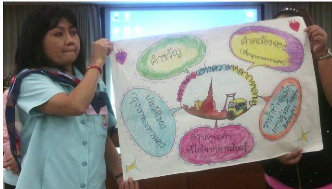
การนำเสนอแผนการเรียนการสอนแบบบูรณาการคุณธรรม จริยธรรมในการจัดการเรียนรู้ เพื่อส่งเสริมค่านิยมหลักของคนไทย 12 ประการ