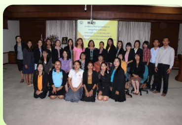
นักทรัพยากรบุคคลชำนาญการ