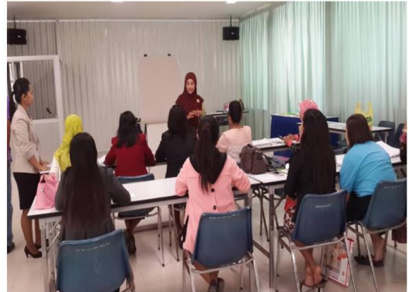
ผู้เข้ารับการพัฒนานำเสนองาน การวิเคราะห์ผู้เรียน และ การออกแบบการจัดการเรียนรู้สู่ความเป็นเลิศ