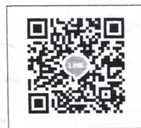
QR-Code เพื่อสอบถามข้อมูล