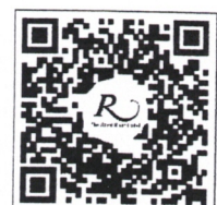
QR CODE สำหรับจองห้องพัก มหาวิทยาลัยศิลปากร

การสำรองห้องพัก ท่านสามารถจองห้องพักกับทางโรงแรมโดยสแกน QR-Code สำหรับจองห้องพัก หากท่านจองห้องพักภายหลังห้องพักอาจเต็มได้ และอาจจะไม่ได้ห้องพักราคาพิเศษซึ่งเป็นอัตราค่าที่พัก โรงแรมรอยัลริเวอร์ ๒๑๙ ซอยจรัญสนิทวงศ์ ๖๖/๑ แขวงบางพลัด เขตบางพลัด กรุงเทพฯ ๑๐๗๐๐ โทรศัพท์: ๐๒-๔๒๒-๙๒๒๒ โทรสาร : ๐๒-๔๓๓-๕๕๘๐ E-mail : rsvn@royalriverhotel.com