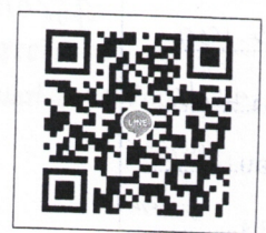
QR-Code เพื่อสอบถามข้อมูล