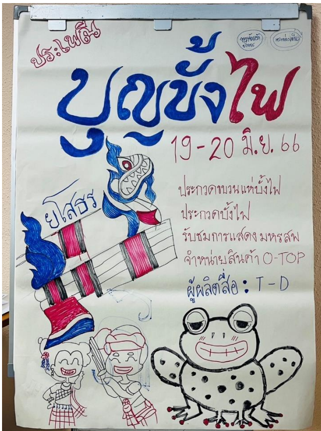
ตัวอย่างผลงานการออกแบบสื่อประชาสัมพันธ์