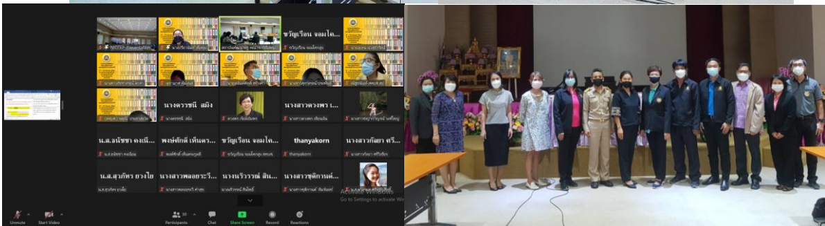
บุคลากร สคบศ. ผู้เข้าร่วมกิจกรรม ณ ห้องประชุมพุทธรักษา และสื่ออิเล็กทรอนิกส์ ด้วยระบบ Zoom