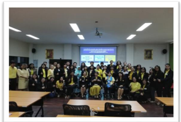
ภาพรวมการดำเนินกิจกรรมการพัฒนาระหว่างวิทยากรผู้เข้ารับการพัฒนาศูนย์การเสริมสร้างศักยภาพของนักวิเคราะห์นโยบายและแผน รุ่นที่ ๑