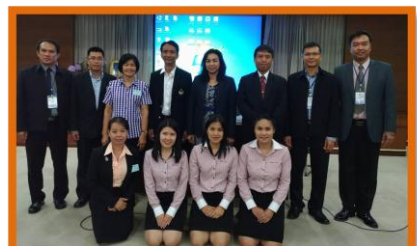
ทีมวิทยากรจาก ก.ศ.ศ. และวิทยากรประจำกลุ่ม จาก ศธจ.