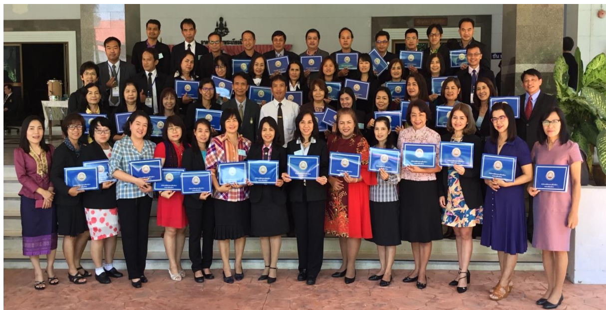
ภาพความสำเร็จของผู้ผ่านการพัฒนาหลักสูตรกฎหมายที่เกี่ยวข้องสำหรับข้าราชการที่ปฏิบัติหน้าที่ฝ่ายเลขานุการของ กศจ. รุ่นที่ 2