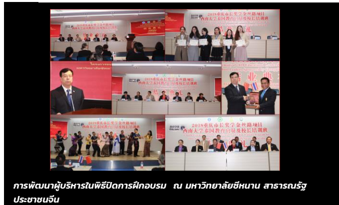
การพัฒนาผู้บริหารในพิธีปิดการฝึกอบรม ณ มหาวิทยาลัยชหนาน สาธารณรัฐประชาชนจีน