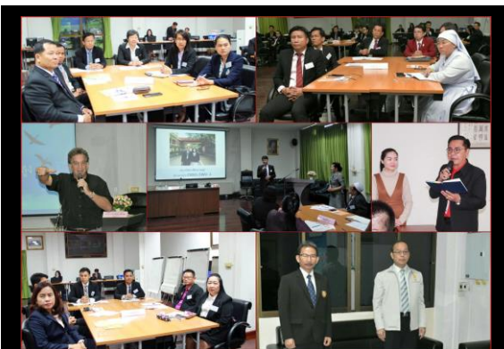
ภาพกิจกรรม การพัฒนาในประเทศ ณ สถาบันพัฒนาครู คณาจารย์ และบุคลากรทางการศึกษา